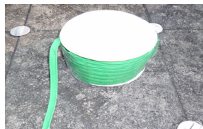
忌避テープ 「当社特許品」