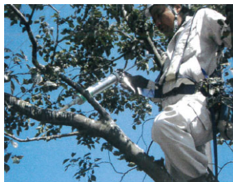
ムクドリの止まる枝にグルーガンで忌避剤を塗布